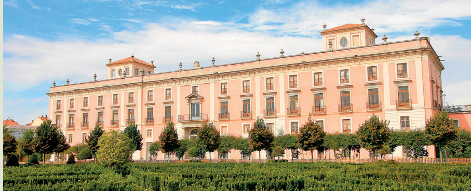
Palacio del Infante Don Luis, Boadilla del Monte, Madrid.